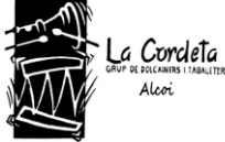
Grup de Dolçainers i Tabaleters La Cordeta