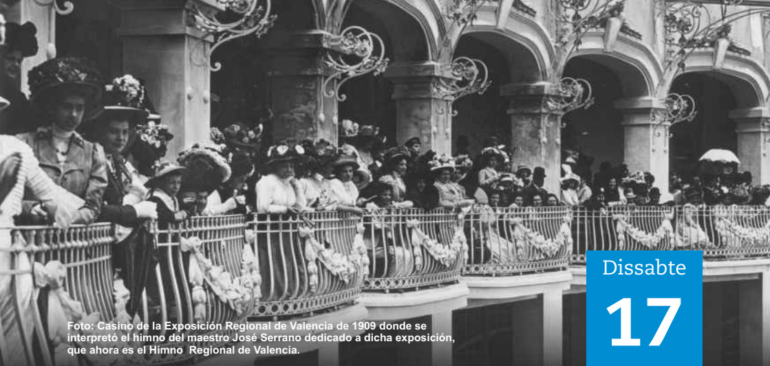
Foto: Casino de la Exposición Regional de Valencia de 1909 donde se interpretó el himno del maestro José Serrano dedicado a dicha exposición, que ahora es el Himno Regional de Valencia.