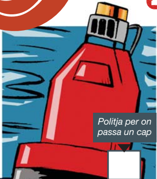
Politja per on passa un cap