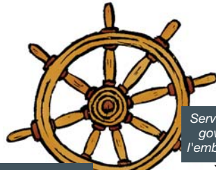
Servix per a governar l'embarcació