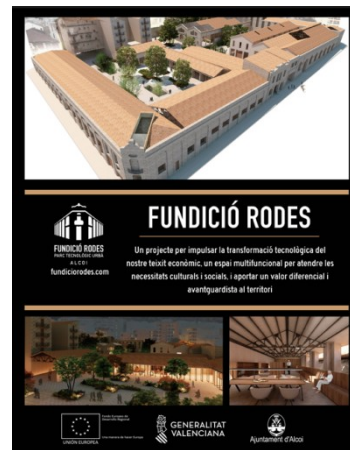
Publicidad en prensa escrita autonómica