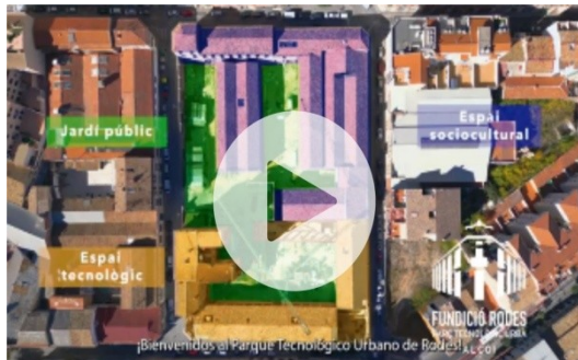
Spot televisivo sobre los usos de Rodes