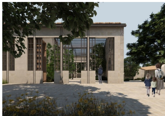
Recreaciones virtuales incluidas en el proyecto ganador del concurso lanzado en 2019 por el Ayuntamiento