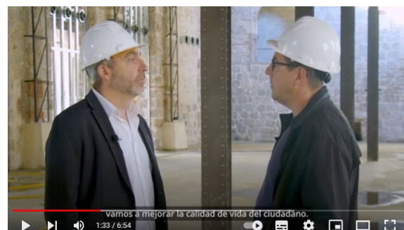
Vídeo publicado en el canal de YouTube municipal