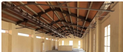
Publicidad en radio sobre la rehabilitación del complejo de Rodes. EDUSI-Alcoidemà